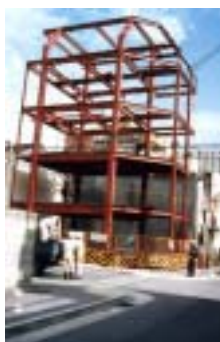
建設中の本社ビル （昭和61年完成）