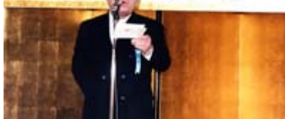
先代の晴れ姿 50周年記念の挨拶